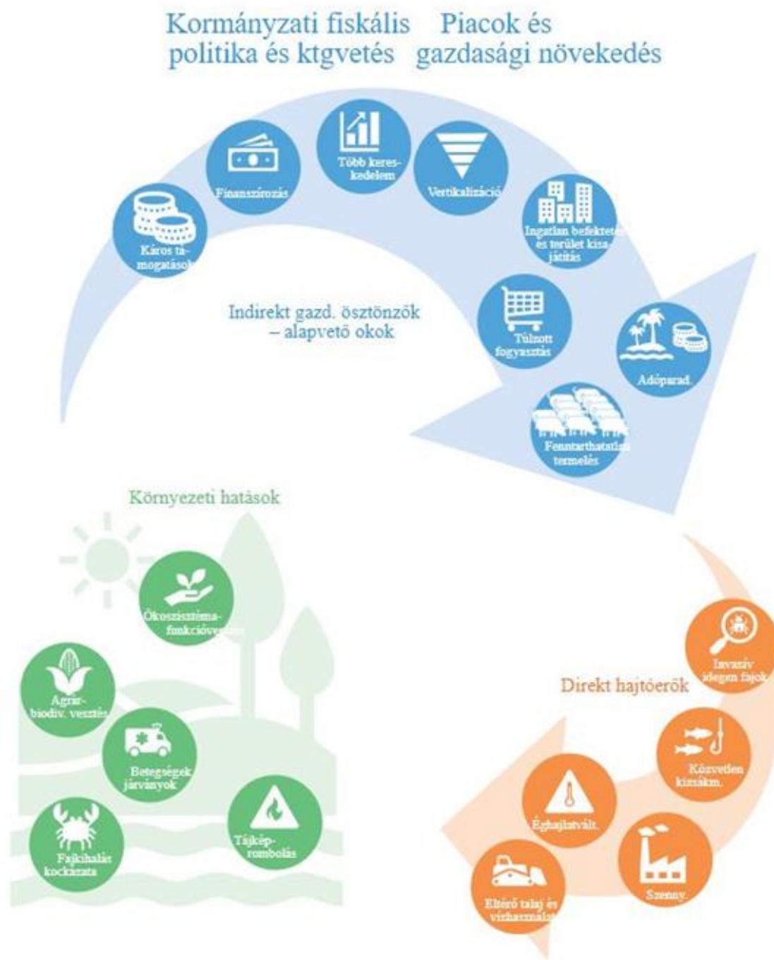
1. ábra A biodiverzitás csökkenésének és az ökoszisztémák átalakulásának fő mozgatórugói (Az IPBES Globális Felmérése öt fő közvetlen hajtóerőt azonosított, amelyek a következő ötven évben jelentősen befolyásolják az ökoszisztémák állapotát /narancssárga körök/, számos környezeti hatást elindítva /zöld körök/. A Globális Felmérés az egyik legfőbb közvetett hajtóerőként határozta meg a gazdaság természetére gyakorolt nyomását. Az ábra kék körökben mutatja a gazdasági keresletben és kínálatban zajló változásokat, amelyek az ökoszisztémák leromlását okozzák.)