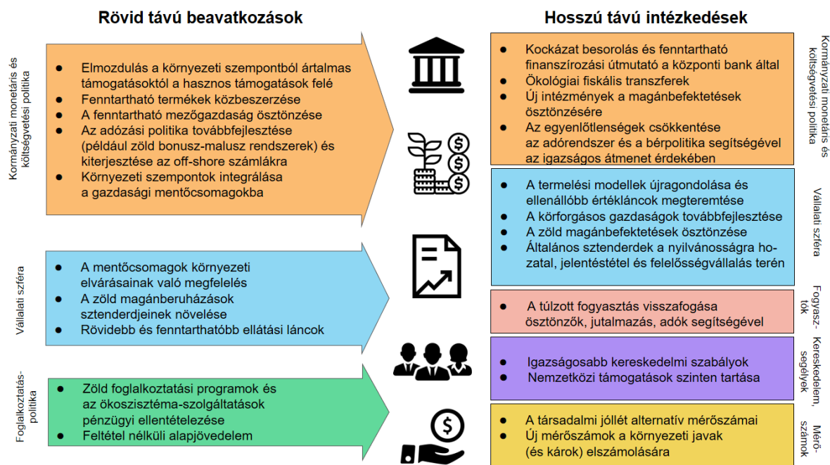
3. ábra Beavatkozási lehetőségek a globális gazdaság átalakítására a környezeti hatások mérséklése érdekében (Rövid és hosszú távú, szektorokon átívelő és minden szereplőre kitérő beavatkozásokra van szükség, hogy a globális gazdaság biodiverzitásra gyakorolt hatásait mérsékelni tudjuk.)

Hosszabb távon elkerülhetetlen, hogy a kormányzati és a piaci szereplők egyaránt elmozduljanak a fenntarthatóbb gazdaság irányába, amely képes a természetvédelmi szempontokat is integrálni. Az IP-BES Globális Felmérése egy sor lehetőséget tárt fel a meglévő szakpolitikák és forgatókönyvek hatékonyságából kiindulva, hogy miként működhet a világunk a jövőben. A jövőt illető transzformatív változások kapcsán nélkülözhetetlen pontként deklarálta, hogy „az egyenlőtlenségek csökkentését be kell építeni a fejlesztési programokba, mérsékelni kell a túlfogyasztást és a pazarlást, és kezelni kell a gazdasági tevékenységek externális környezeti hatásait, helyi és globális szinten egyaránt” [1]. A következőkben néhány kulcsfontosságú lépést mutatunk be, amelyek segítségünkre lehetnek a gazdasági rendszer transzformatív átalakítása során (3. ábra).